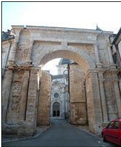
Porte Noire (Röm. Triumphbogen)

Mit dieser Reise wollen wir Ihnen Gelegenheit geben, Besançon näher kennen zu lernen.